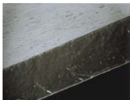
Die porenlose Sympatex-Membran

Das Geheimnis von Funktionsbekleidung liegt in der eingearbeiteten Membran: Diese Schicht ist hauchdünn und meist mit dem Oberstoff fest laminiert. Die Membran übernimmt die Verantwortung für die Wasser- und Winddichtigkeit sowie für die Atmungsaktivität. So unterstützt sie die Klimaregulierung des Körpers bzw. der Füße – man bleibt trocken und hat ein angenehmes Tragegefühl. Die Sympatex-Membran ist eine geschlossene Membran und bietet zwei entscheidende Vorteile gegenüber porösen PTFE-Membranen wie etwa Gore-Tex oder eVent: Das Sympatex-Material besitzt keine Poren und kann somit nicht durch Schmutz oder Salzkristalle (Schweiß) verstopfen, die sie in ihrer Funktionalität einschränken könnten. Feuchtigkeit wird stattdessen durch einen chemisch-physikalischen Prozess